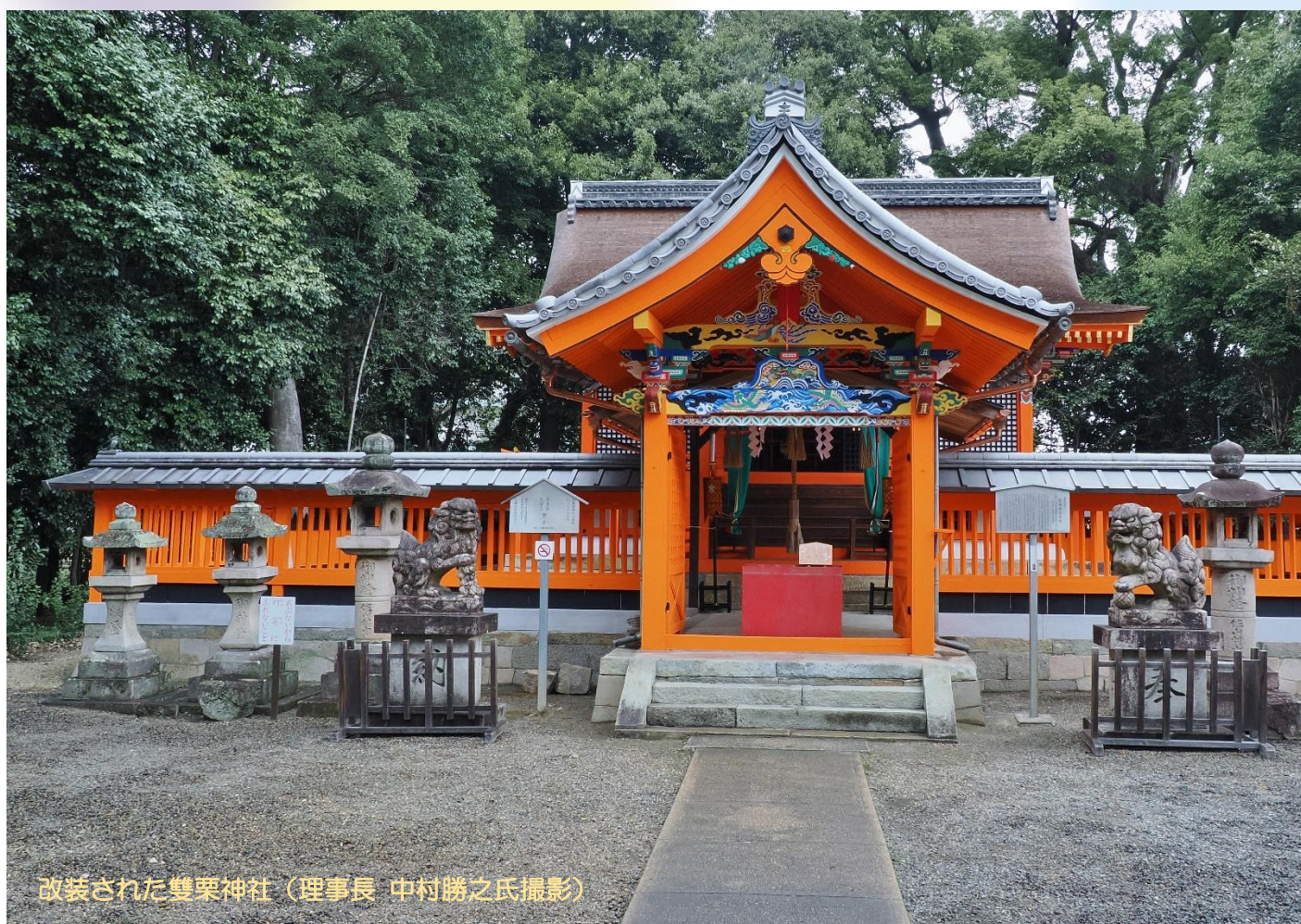
改装された雙栗神社